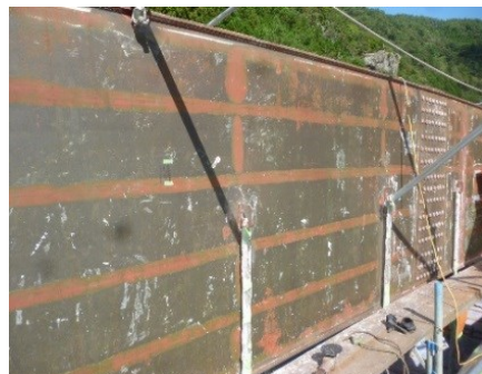
剥離後の残存塗膜