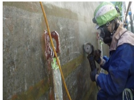
ブリストルブラスターW処理